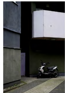
BUILDING 3 2013 Digital Print Auflage 10 Bildmass 50 X 75 cm Blattmass 61,5 X 89 cm Preis ohne Rahmen 1000,00 € Preis mit Rahmen 1200,00 €