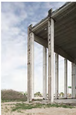
LANDSCAPE 3 2012 Digital Print Auflage 10 Bildmass 50 X 75 cm Blattmass 61,5 X 89 cm Preis ohne Rahmen 1000,00 € Preis mit Rahmen 1200,00 €